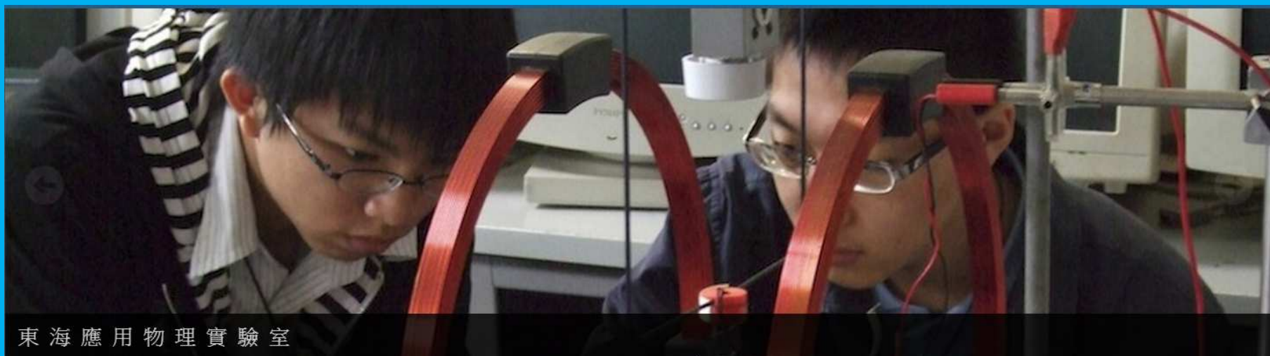
東海應用物理實驗室

本系提供給學生豐沛的學習資源於教學實驗室及專題研究實驗室。每年編列經常性耗材預算，鼓勵同學們精進實驗技能。