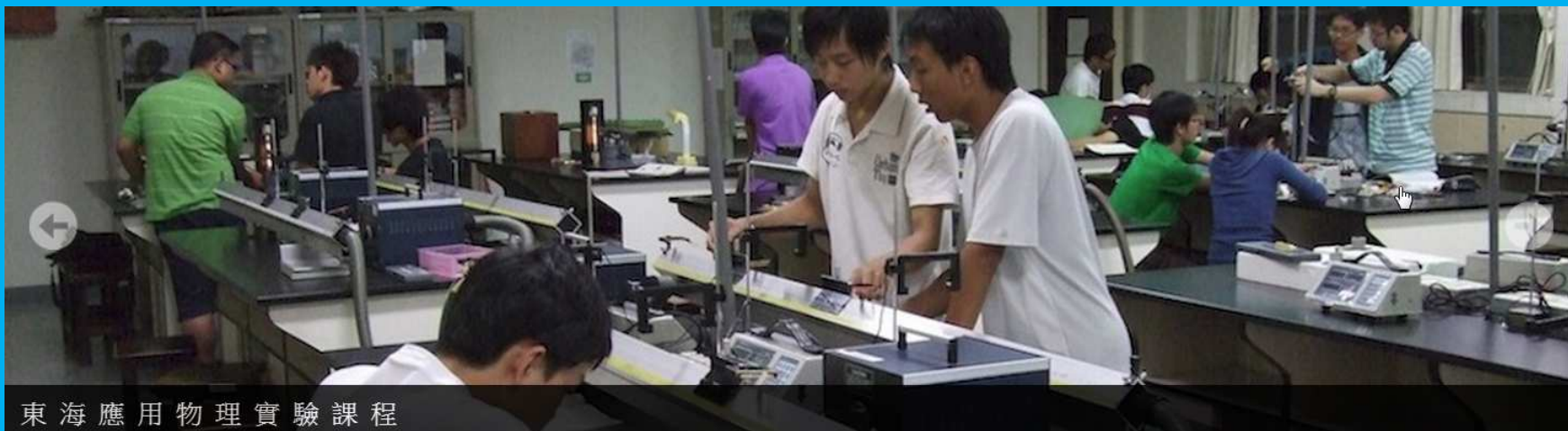
東海應用物理實驗課程

本系提供給學生豐沛的學習資源於教學實驗室及專題研究實驗室。每年編列經常性耗材預算，鼓勵同學們精進實驗技能。