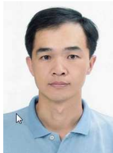
「教學優良獎」得獎人 (依學院系別排序)